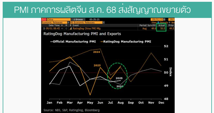
ที่มา : BLOOMBERG, สายงานวิจัย บล.เอเชีย พลัส (ข้อมูล 1 ก.ย. 68)

ผู้นำ BRICS บัดประมุขหารือภาคีกรุป ในวันที่ 8 ก.ย. 68 พร้อมส่งเสริมแนวทาง พหุภาคี (MULTILATERALISM) ในการรับมือกับแรงกดดันจากสหรัฐฯ หลังเห็นสัญญาณสหรัฐฯ พยายามกีดกันทางการค้าของประเทศสมาชิกในกลุ่ม BRICS สะท้อนจาก