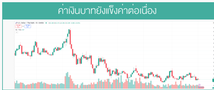
(ข้อมูล 1 ก.ย. 68)

ค่าเงินบาทอยู่ในโซนแข็งค่า พร้อมกับราคาน้ำมันเริ่มฟื้น +1.3% ในวานนี้ ดัชนีหุ้นไทยที่อิงราคา COMODITY ถึง 1 ใน 3