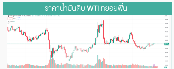
ที่มา : TRADINGVIEW, สายงานวิจัย น.า.เอเชีย พลัส (ข้อมูล 1 ก.ย. 68)

แนะนำหุ้นเด่น PTTEP, CPALL, SPALI และ DR : LVMH01, TENCENT80